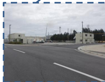
友愛医療センター脇の道路、最初の交差点を右折

道路改築により、那覇空港シーサイド店へのルートが一部変更になります。現在も一部が工事の為、通行の際は徐行運転にてお願いいたします。6/2～6/4の間中は、う回路の案内となります(別紙参照)