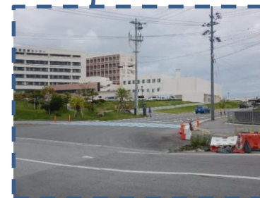
友愛医療センター脇の道路へ